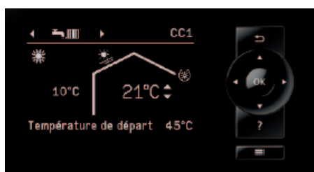
Display de la régulation de pompe à chaleur Vitotronic 200